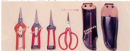
赤芽切鉈 ステン芽切鉈 東北型芽切鉈 ステンブドウ切鉈 津軽型剪定皮ケース 盛型剪定皮ケース